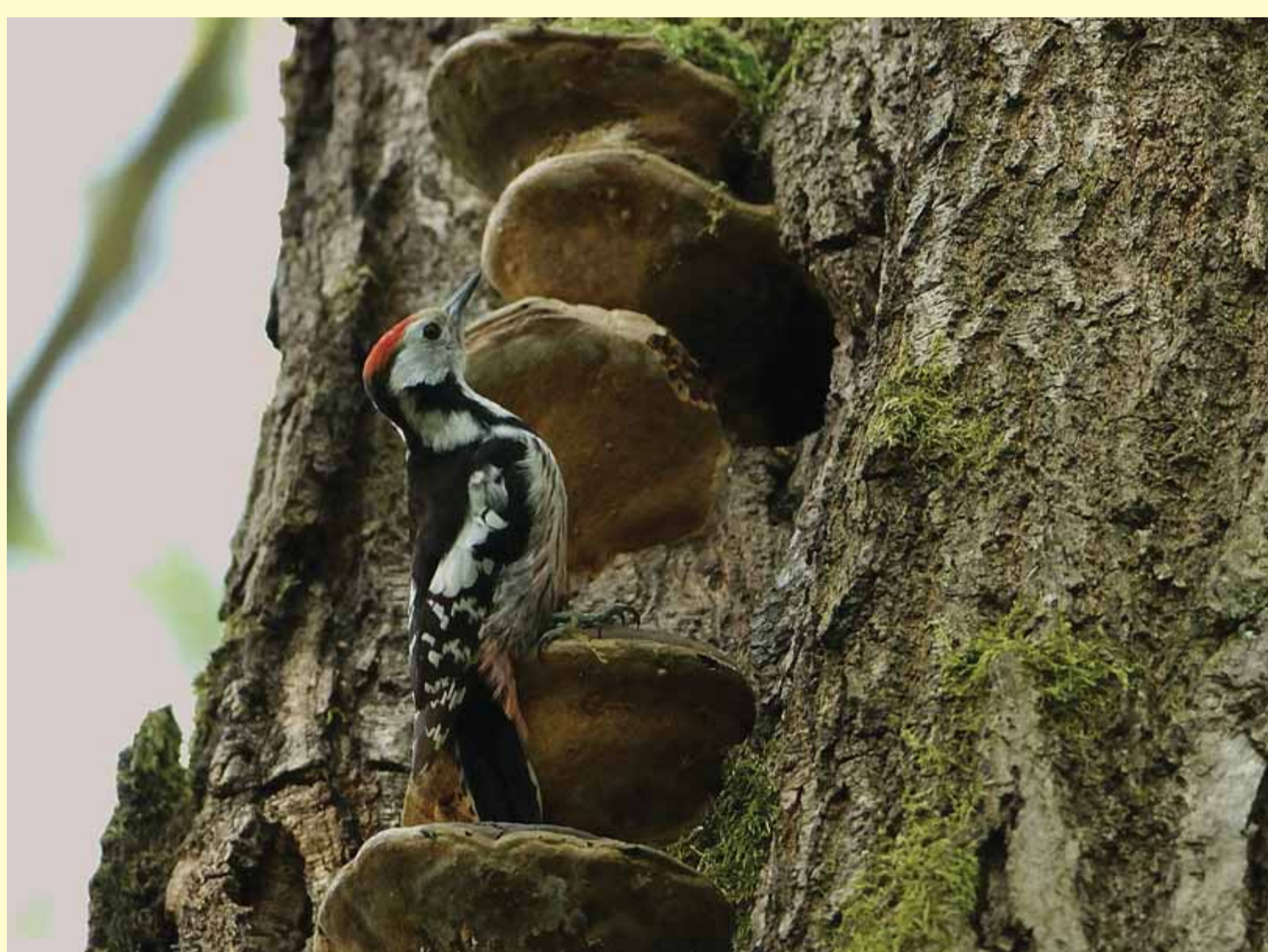
Srednji detel pred gnezdilnim duplom, izdolbljenim v trhlem delu debla

je eden največjih kompleksov nižinskih poplavnih gozdov doba in belega gabra v Sloveniji. Tu živijo redke in ogrožene ptice npr. srednji detel, črna štokrlja, ... Odmirajoči hrasti so pomembni za razvoj ličink hroščev hrastovega kozlička in rogača. Mokrišča v gozdu so ugoden življenjski prostor dvoživk, kot so veliki pupek ter nižinski in hribski urh.