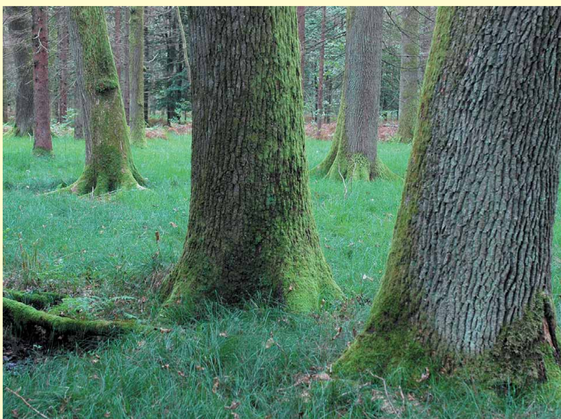
Značilen sestoj hrastov v Dobravi