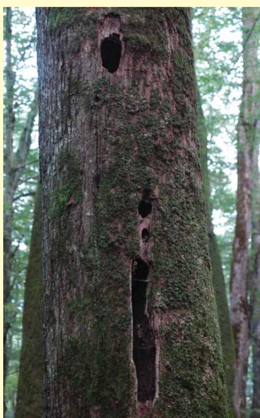
Mogočni razvejani hrasti z dupli so primerne ekocelice