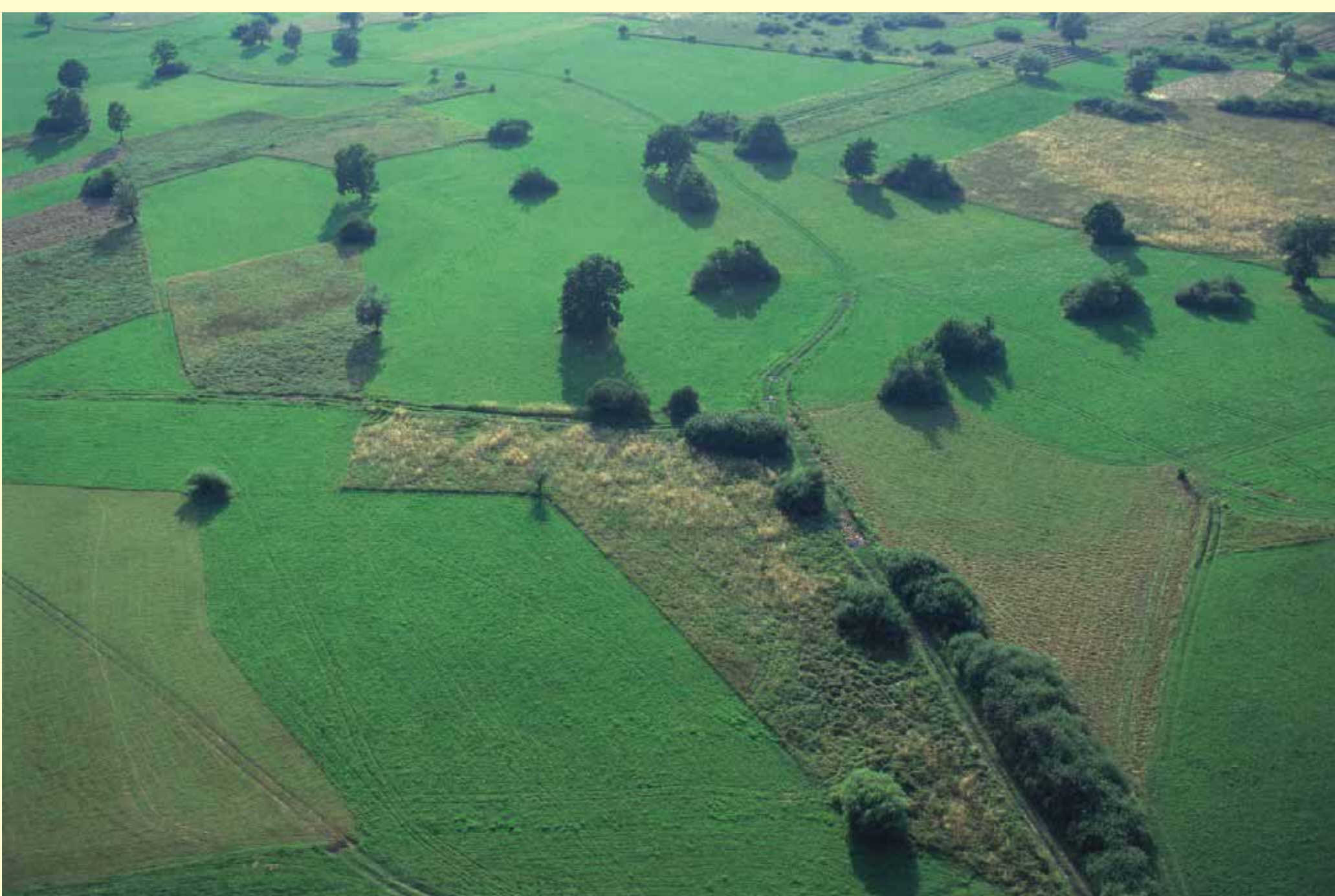
Značilen življenjski prostor kosca v Jovsih