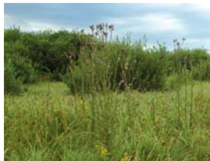
Zaradi zaraščanja izginjajo travniki