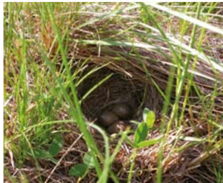
Pozna košnja ohranja zarod travniških ptic

Košnja po 15. juliju omogoča večini travniških vrst nemoten razvoj, saj večina od njih do tega datuma že odcveti, se pari ali spelje mladiče.