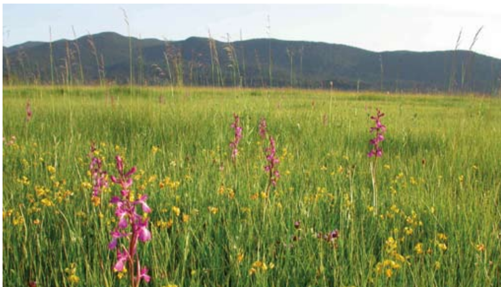
Barvita pestrost travnikov

Ministrstvo za kmetijstvo, gozdarstvo in prehrano podpira prizadevanja za ohranitev pozno košenih travnikov v Sloveniji. Podukrep HAB 214-III/2 Ohranjanje posebnih travniških habitatov je namenjen vzpodbujanju izvajanja prilagojene kmetijske prakse, ki poleg pridelave krme skrbi tudi za ohranjanje pozno košenih travnikov in na njih prisotnih ogroženih vrst.