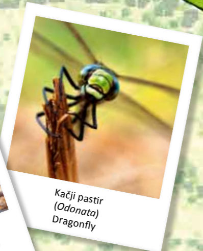
Kačji pastir ( Odonata ) Dragonfly