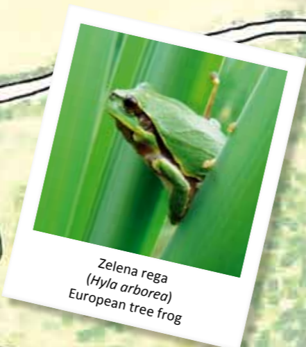
Zelena rega ( Hyla arborea ) European tree frog